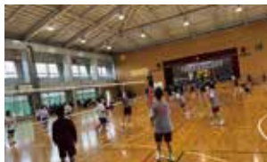
新入生歓迎球技大会