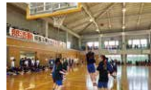
新入生歓迎球技大会