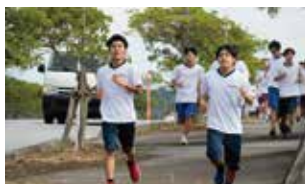
ロードレース大会