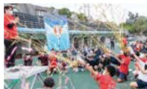
ロードレース大会