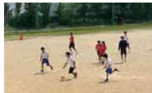
新入生歓迎球技大会