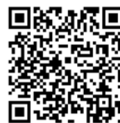
進学資金シミュレーター