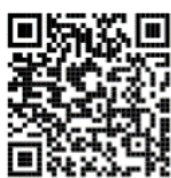
貸与・返還シミュレーション