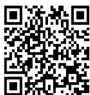
奨学金を希望するみなさんへ (動画)

ホーム/奨学金 → その他お役立ち情報 → 各種案内・リーフレット → 貸与・返還シミュレーター → 進学資金シミュレーター